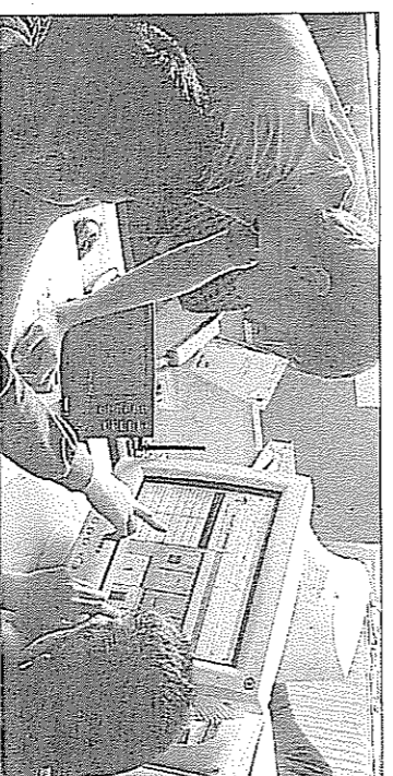
Durante su visita a la CAC, conocieron más instrumentos.

Bajo el título de 'Atmósfera', la iniciativa pretende acercar a los escolares al conocimiento de la meteorología. Una de las actividades emmarcadas en esta propuesta es la confección de una base de datos meteorológicos de la localidad, a través de la estación automática e inalámbrica con la que cuenta el centro. Además, el colegio es actualmente un centro colaborador de Canal 9, cuya misión es el aporte de datos meteorológicos para que estos puedan ser empleados en el