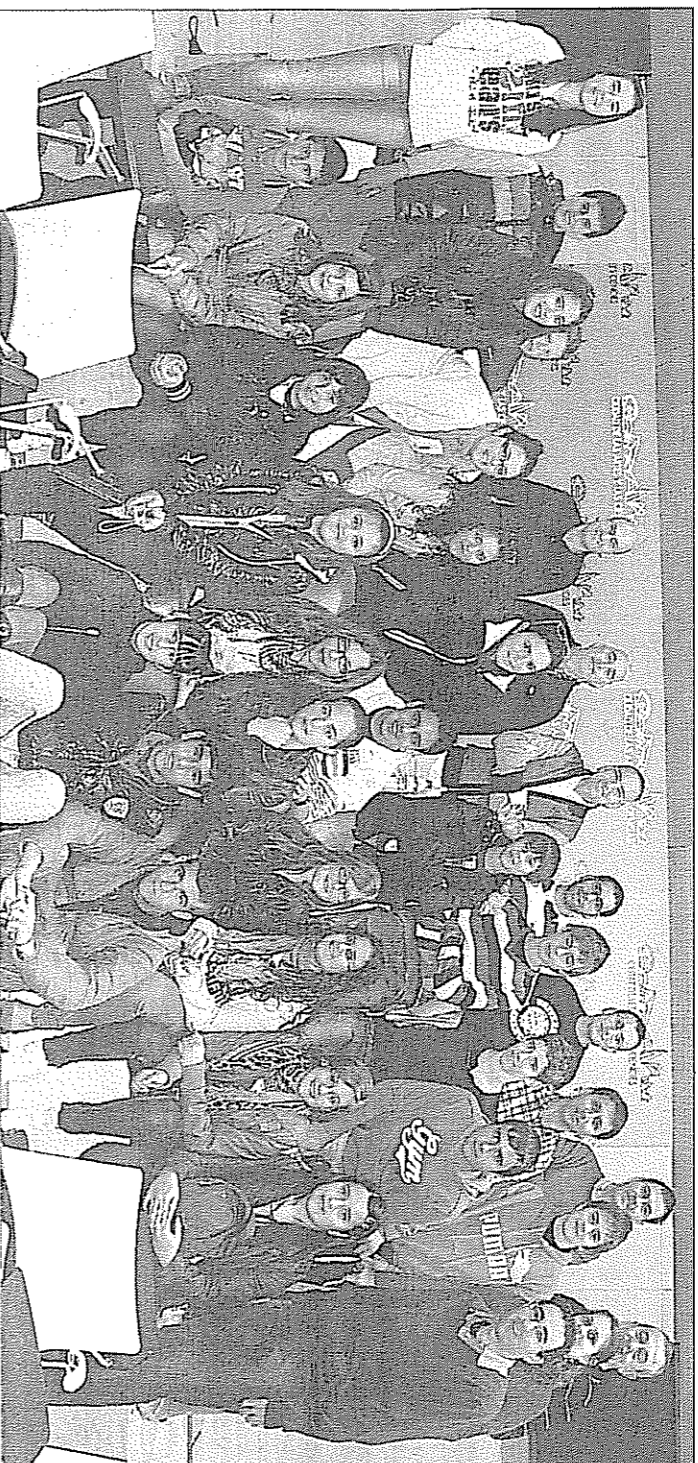
Los alumnos del instituto vila-realense participa en un proyecto fundamentado en esta temática, que lleva por nombre 'Atmósfera'.